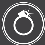
ОСИГУРУВАЊЕ ОД ПРОВАЛНА КРАЖБА И РАЗБОЈНИШТВО