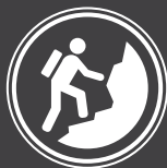
ОСИГУРУВАЊЕ НА ЛИЦА ОД НЕЗГОДА