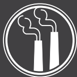
ОСИГУРУВАЊЕ НА ИНДУСТРИЈА