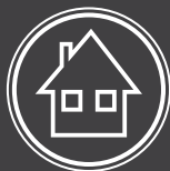
ОСИГУРУВАЊЕ НА ДОМАКИНСТВО