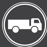
ОСИГУРУВАЊЕ НА ТРАНСПОРТ