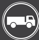
ОСИГУРУВАЊЕ НА ТРАНСПОРТ