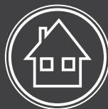
ОСИГУРУВАЊЕ НА ДОМАКИНСТВО