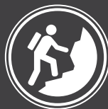
ОСИГУРУВАЊЕ НА ЛИЦА ОД НЕЗГОДА